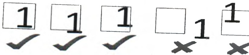
Ejemplo de Marcado Célula de Sufragio